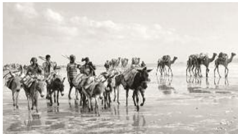
Sie bedeutet Leben: der Völker, der Natur, unseres gesamten Planeten.

Die Slow-Food-Bewegung entstand – wie könnte es anders sein? – in Italien, genauer gesagt im Piemont, genauer gesagt durch die Initiative von Carlo Petrini, genauer gesagt im Jahre 1986. Hier hat das Essen als Genuss und soziales Ereignis die Hektik und die Banalisierung des 20. Jahrhunderts überlebt, nicht als Überfluss, sondern aus Bescheidenheit und Qualitätsbewusstsein. Signor Petrini und sein Freundeskreis woll-