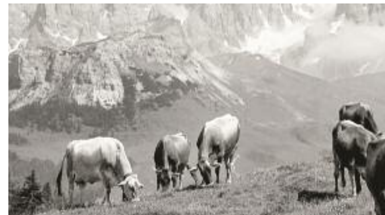
Die Förderkreise arbeiten daran, dass den Bauern, Hirten, Fischern und Handwerkern die ihrem Wissen und Engagement entsprechende Wertschätzung entgegengebracht wird.

Dal punto di vista del Premio Binding per la natura e la tutela dell'ambiente, possiamo dunque con grande gioia dichiarare: evidentemente, l'amore per l'ambiente va attraverso lo stomaco! L'attenta esperienza della qualità nel mangiare e nel bere promuove le reti locali e la cultura regionale, e mobilita l'impegno della gente per i modi di produzione sostenibili, in modo concreto, nell'immediato ambiente della vita quotidiana. Per questo noi conferiamo il Grande Premio Binding 2007 a un'idea sorprendente e alla sua realizzazione continuativa e al suo ulteriore sviluppo. Quanto convincente sia questa via «attraverso lo stomaco» viene dimostrato dalla circostanza che l'idea Slow Food in campo di gastronomia si sviluppa ulteriormente e si propaga in altri ambiti di vita: esiste già una rete di slow cities, si parla di Slow Life come di un nuovo stile di vita, di viaggiare slow, e molto di più. Sì, è sorprendente sentire di una catena di fast food che vuole adesso ristrutturare gli spazi in lounges, per poter invitare i propri clienti ad attardarsi nei propri locali. In questo modo l'idea Slow Food è tornata agli inizi (ovvero l'irritazione della in-cultura delle queste offerte) – la decelerazione come un nuovo megatrend!