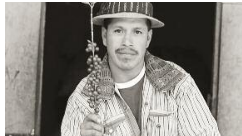
Der Begriff Biologische Vielfalt umfasst die Menschen und wilde wie auch gezüchtete Pflanzen und Tiere.

Il movimento Slow Food si è formato – e come potrebbe essere altrimenti? – in Italia, più precisamente in Piemonte, più precisamente grazie alla iniziativa di Carlo Petrini, più precisamente nel 1986. In quelle circostanze il cibo inteso come gusto e come evento sociale riesce a superare e a sopravvivere alla frenesia e alla banalizzazione del 20° secolo, non inteso quindi come qualche cosa di superfluo o sovrabbondante ma qualche cosa di modesto, di consapevole e di qualitativo. Si-