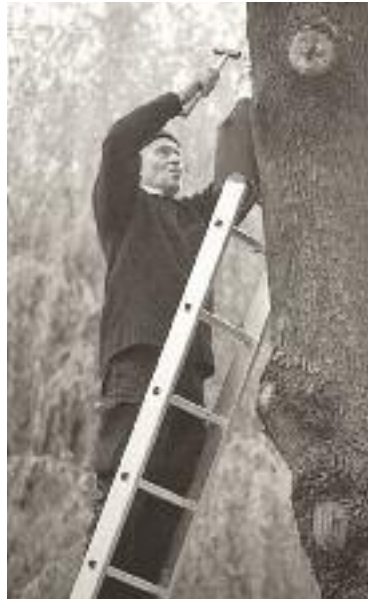
Die Beobachtung der Flugrouten der nachtaktiven Fledermäuse wie dieser Zwergfledermaus ist nur mittels Besenderung möglich. Nistkästen können fehlende Baumhöhlen ersetzen.

Dotationssumme für einen Binding-Preis auf CHF 15 000.– erhöht, damit wir die drei Auszeichnenden zu gleichen Teilen bedienen können.