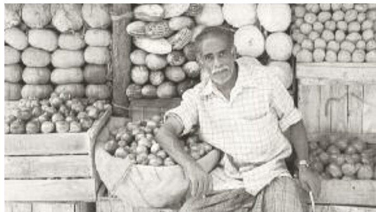
Die Slow Food Stiftung baut gerade ein Netzwerk von Bauernmärkten.

Aus der Sicht des Binding-Preises für Natur- und Umweltschutz können wir also mit grosser Freude feststellen: Offensichtlich geht die Liebe für die Umwelt durch den Magen! Die sinnliche Erfahrung von Qualität beim Essen und Trinken fördert die lokalen Netzwerke und die regionale Kultur, und sie mobilisiert Menschen zum Einsatz für nachhaltige Produktionsweisen ganz konkret in ihrem unmittelbaren Alltagsumfeld. Wir verleihen damit den Grossen Binding-Preis 2007 an eine überraschende Idee und ihre kontinuierliche Umsetzung und Weiterentwicklung. Wie überzeugend dieser Weg durch den Magen ist zeigt der Umstand, dass sich die Slow-Food-Idee über das Feld der Gastronomie hinaus ausdehnt und weitere Lebensbereiche infiltriert: schon gibt es eine Vereinigung von «Slow Cities», man spricht von SlowLife als neuem Lebensstil, von SlowTravelling, und vieles mehr. Ja, man höre und staune, sogar eine Fast-Food-Kette will jetzt ihre joints umbauen in Lounges, um ihre Kunden zum Verweilen einzuladen. Damit ist die Slow-Food-Idee an ihren Ausgangspunkt (nämlich die Irritation der Un-Kultur dieser Angebote) zurückgekehrt – Entschleunigung als neuer Megatrend!