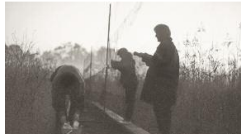
Der Klimawandel hat auch Auswirkungen auf die ziehenden Vogelarten. An solchen Abfangstationen wird durch Beringung mehr über den Vogelzug erfahren.