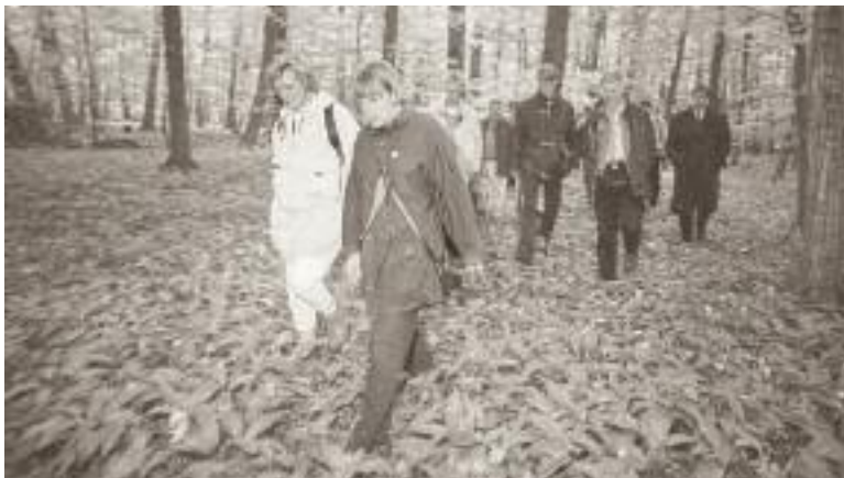
Die Preisträgerin mit der früheren Umweltministerin und heutigen Kanzlerin Angela Merkel anlässlich einer Unterstützungsveranstaltung für den Nationalpark Hainich im Jahre 1998.

Ich habe mich in bester Absicht bemüht, Unruhe zu stiften – wo Ruhe, wo Zufriedenheit, Gleichgültigkeit und Unwissenheit der Sache des Naturschutzes schaden und Veränderungen zum Besseren lähmen. Im Naturschutz, so mein wenig überraschendes Fazit, ist bei weitem nicht genug erreicht. Überraschend dagegen finde ich, dass daran aber nicht nur die Naturschutz-Gegner schuld sind. Ausgerechnet unter denen, die qua-